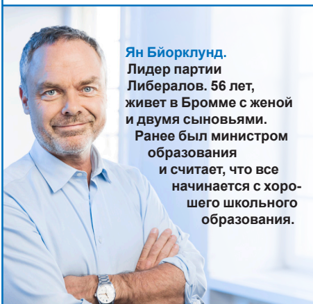
Ян Бйоркклунд. Лидер партии Либералов. 56 лет, живет в Бромме с женой и двумя сыновьями. Ранее был министром образования и считает, что все начинается с хоро- шего школьного образования.

Правительство. Либералы хотят сформировать новое правительство вместе с другими партиями, входящими в состав Альянса: М, С и КД. Либералы не будут входить в правительство, в котором Шведские демократы будут иметь влияние на позицию правительства.